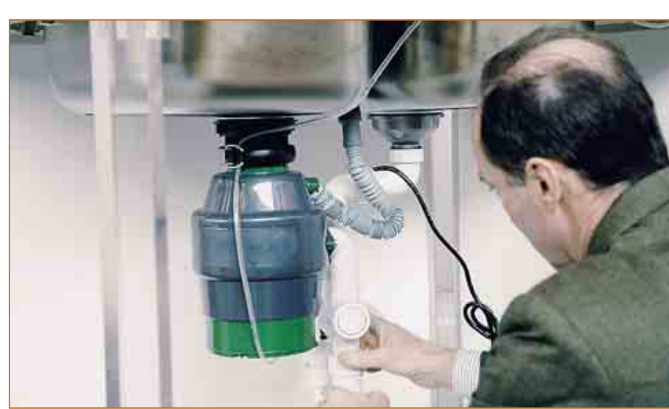
Nuovo macchinario e depuratore domestico della Ecofast

Mauri, maghi del poliuretano: pure dal mais nuovi materiali