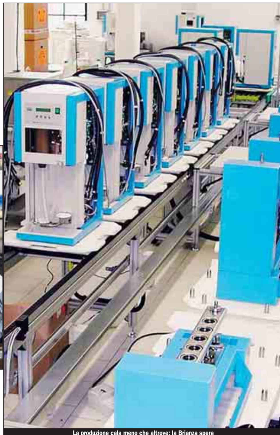
La produzione cala meno che altrove: la Brianza spera