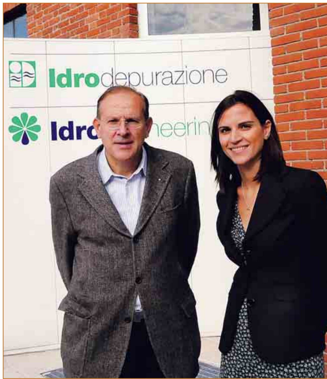
Il titolare della Idrodepurazione con la figlia

portante per le Pmi che altrimenti non avrebbero mai la possibilità di fare ricerca. Al momento il progetto si trova a metà del suo svolgimento: stiamo infatti prototipando il primo pezzo che successivamente verrà testato dagli istituti di ricerca coinvolti in Legiotex. Nella fase di analisi verrà creato un software che verificherà la configurazione migliore del filtro per combattere il batterio». La Idrodepurazione si occupa sul territorio dal 1977, occupandosi di tematiche ambientali, bonifiche e di potabilizzazione civile e industriale. Vi lavorano 20 addetti e di recente ha cominciato a dedicarsi anche al mercato dei trattamenti rifiuti organici e alla produzione di energie rinnovabili da biomasse e biogas. Con il medesimo gruppo di lavoro di Legiotex ha presentato un progetto per sviluppare sistemi di depurazione per l'acquacoltura.