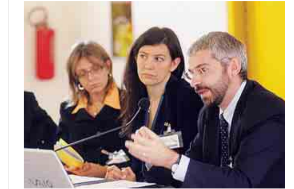
IL GRISS DELLA BICOCCA