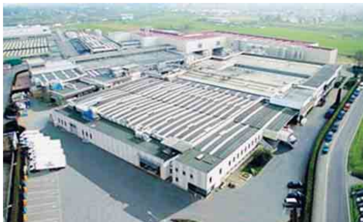
Lo stabilimento della Lat Bri

storazione: «La competizione negli ultimi anni è stata pesante, specie per le mozzarelle, che non essendo Dop possono essere fatte da tutti - prosegue Scibona -. Noi abbiamo introdotto un prodotto 'premium', cioè di altissima qualità a marchio Lat-Bri e un prodotto cubettato di alto livello per la ristorazione. Abbiamo poi lanciato una serie di prodotti in monoporzionatura per rispondere alle esigenze dei single e per evitare sprechi». La Lat Bri produce non solo a marchio proprio, ma anche per le principali catene della grande distribuzione e soprattutto si è conquistata la fiducia di colossi del food service che si trovano nelle città e lungo le autostrade di tutta Italia. «Il 2009 è stato un anno di crisi probabilmente per molte aziende, ma tutto sommato il settore alimentare ha tenuto - conclude il direttore marketing -. Quest'anno pensiamo di chiudere in linea con il 2008 o forse addirittura un 5 per cento sopra. Per il 2010 le nuove strategie di mercato prevedono di implementare la produzione e soprattutto la comunicazione dei prodotti a marchio proprio». Attualmente il mercato di Lat-Bri è in prevalenza concentrato in Italia (70 per cento), ma le mozzarelle e i formaggi di Usmate arrivano anche all'estero attraverso i più importanti marchi della grande distribuzione.