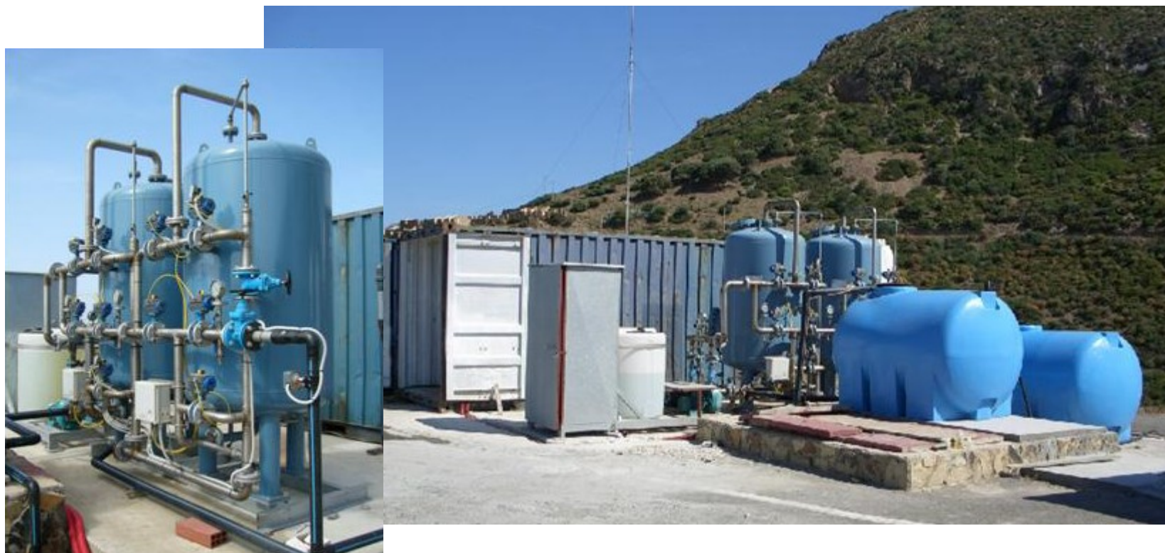
IMPIANTO DI POTABILIZZAZIONE - PORTATA 36 m 3 /h DRINKING WATER TREATMENT PLANT- FLOW RATE - 36 m 3 /h