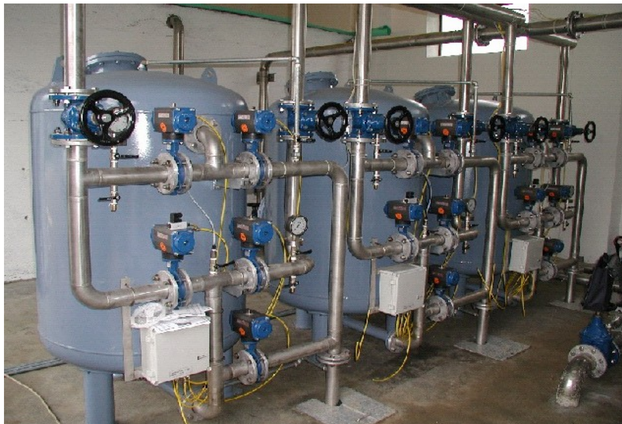
IMPIANTO DI POTABILIZZAZIONE - PORTATA 50 m 3 /h DRINKING WATER TREATMENT PLANT- FLOW RATE - 50 m 3 /h