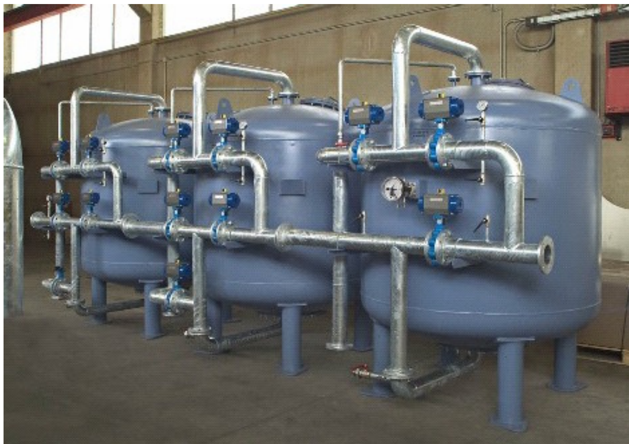
IMPIANTO DI POTABILIZZAZIONE - PORTATA 100 m 3 /h DRINKING WATER TREATMENT PLANT- FLOW RATE - 100 m 3 /h