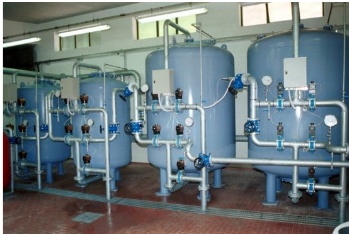
IMPIANTO DI POTABILIZZAZIONE - PORTATA 70 m 3 /h DRINKING WATER TREATMENT PLANT- FLOW RATE - 70 m 3 /h